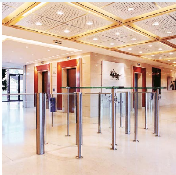
Versión con hojas de puerta de cristal y altura especial