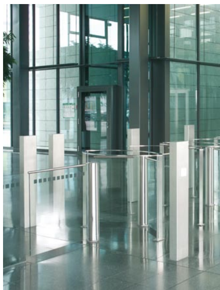
Combinación con puerta de batiente automática, para el acceso de personas con movilidad reducida