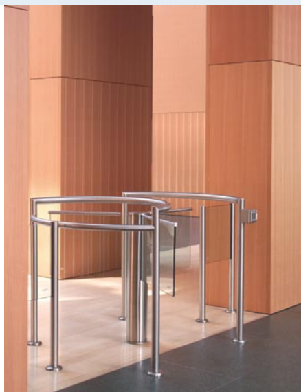
Una armoniosa combinación: la calidez de la madera y la nitidez del cristal y el acero inoxidable