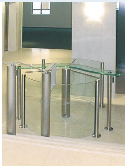
Una solución elegante a los problemas de espacio, con dispositivos de paso Charon