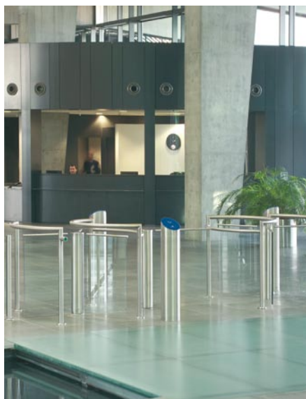
Instalación múltiple en vestíbulo, a la vista del personal de recepción