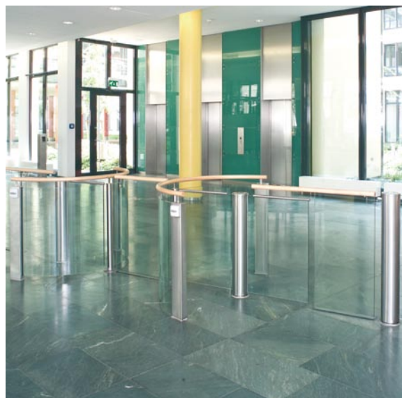
Modelo con puerta de batiente integrada, para el paso de mercancías y un máximo aprovechamiento del espacio